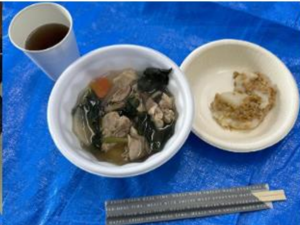
【絶品のお雑煮と粘りの効いた納豆餅】

2025年！最高の幕開けです！1月の全国高校選手権県予選で良い結果が出せるようがんばります！