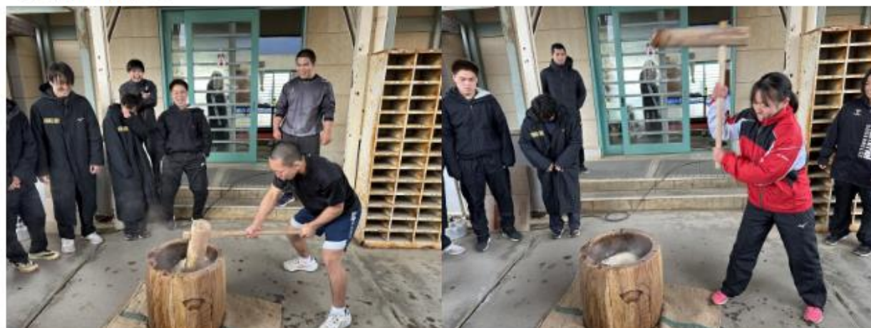
【みんなを爆笑に陥れた餅つき (by荒川)】