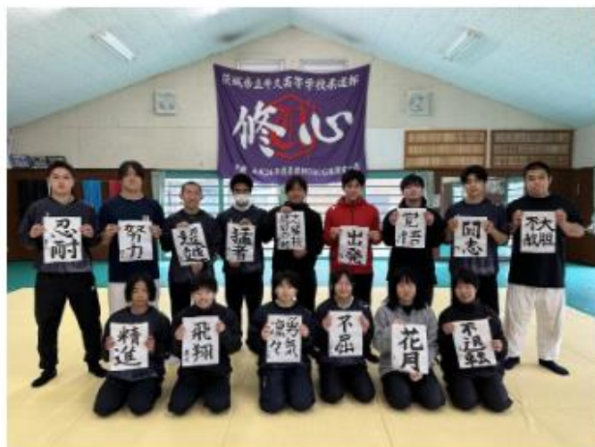
【今年の思いを書初めにて！】