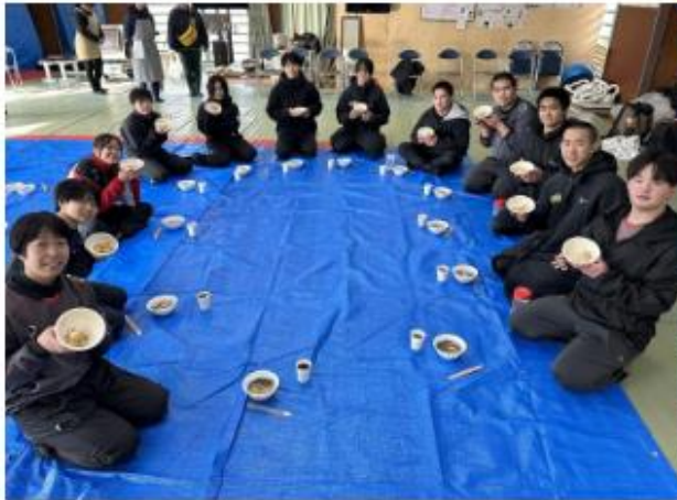
【みんなでお餅を囲みながら実食】

また、お雑煮も保護者の皆さんが心を込めて作ってください、懐石料理に出てきてもおかしくないお出汁のきいたとても美味しい絶品お雑煮でした！いつもいつもご協力ありがとうございます！